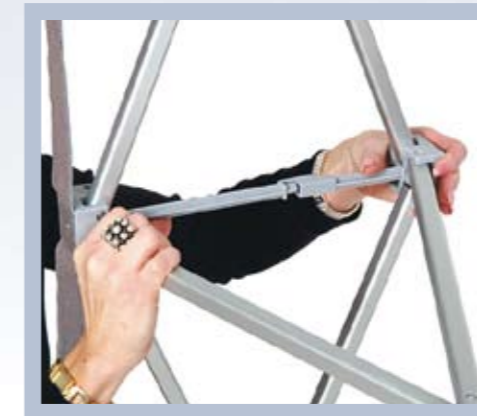
Die Konstruktion wird mit einem Schnappverschluss gesichert.