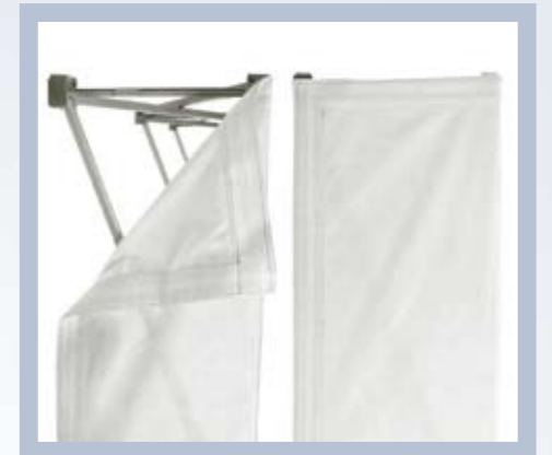
Der Stoffdruck wird mit einem praktischen Klettband befestigt, wahlweise an der Vorderseite oder zusätzlich auf den Seiten.

ANLEITUNGEN – SIEHE DEN GANZEN FILM UNTER WWW.EXPOLINC.DE