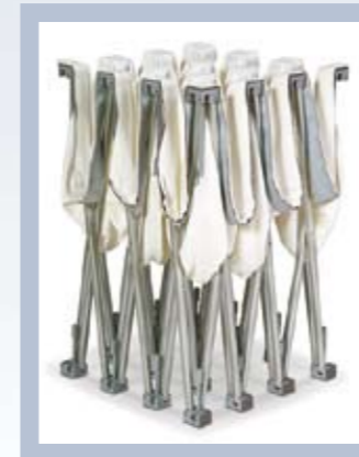
Durchdachte, „Alles-in-einem“-Konstruktion mit niedrigem Gewicht, weshalb sich das System einfach mitnehmen lässt.