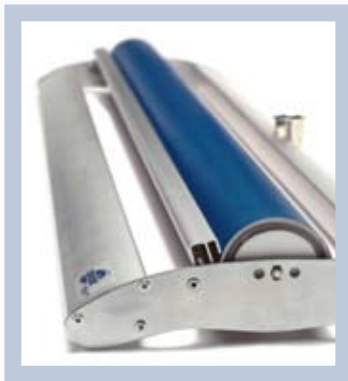
Das Gehäuse hat ein geringes Gewicht und besitzt ein ansprechendes, funktionelles Design.

Ob bei einer großangelegten Einführungskampagne oder bei einem Einzelevent – mit dem Roll Up Promotion bieten wir Ihnen das optimale System, um mehrfach mit ein und dem gleichen System Ihre Botschaft zu präsentieren. Es ist erhältlich im Format 80 x 200 cm und wird in einer robusten Transportverpackung geliefert.