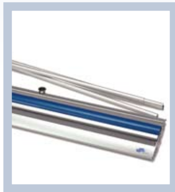
Führen Sie die Panelstange in das Gehäuse ein und ziehen Sie die Grafik hoch – fertig!