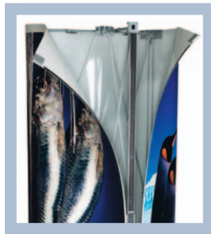
Die Grafikbahnen lassen sich leicht auf- und abbauen.