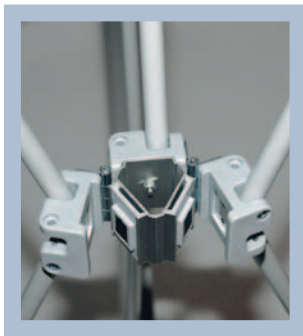
Dieselbe magnetische Funktion wie die übrigen Systeme der Produktfamilie.