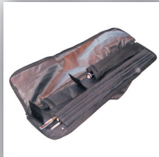
4. Transporttasche mit Unterteilungen