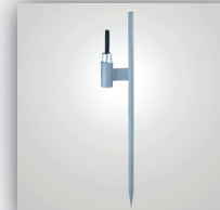
7. Erdanker einfach, mit Aufschraubhülse, kugelgelagert