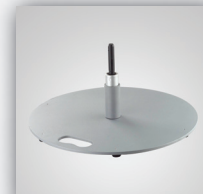
9. Bodenplatte 12,5 kg rund mit Rotator, kugelgelagert