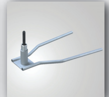
8. Paletten- oder Kfz-Fuss, mit Rotator, kugelgelagert