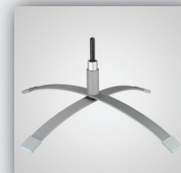
11. Ellipsenfuss mit Rotator, kugelgelagert