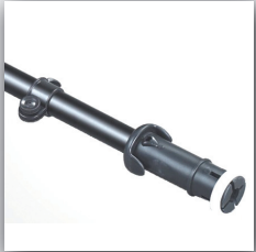
1. Verstärkter Alu-Mast m. Fiberglasrute. Verstellbare Einhängung mit Diebstahlsicherung