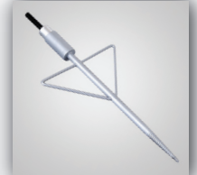
6. Erdanker Stahl für Beton, m. Aufschraubhülse, kugelgelagert