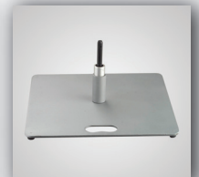
10. Bodenplatte 15 kg quadratisch mit Rotator, kugelgelagert