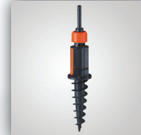
5. Erdanker PVC für weiche Böden, kugelgelagert