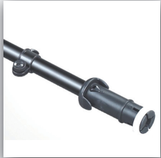
1. Verstärkter Alu-Mast und Ausleger