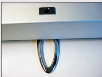
verchromter, extra schwerer Standfuß